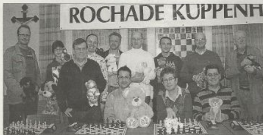
Die Rochade-Spieler lassen sich beim Meister-Petz-Blitz gerne Bären und andere Tierchen aufbinden.